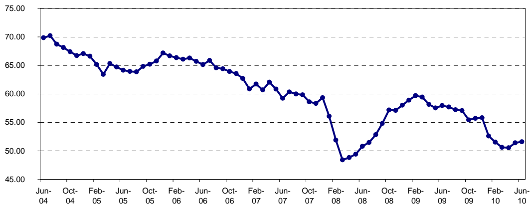
PARTICIPACION DE LOS DEPOSITOS TOTALES EN MONEDA EXTRANJERA: Jun 04 - Jun 10 (en porcentaje)

En junio de 2010, la participación de los depósitos en moneda extranjera respecto del total continuó aumentando levemente, y reportó 51.62%. Esta proporción fue mayor en 0.20 puntos porcentuales en relación con mayo del presente año, pero menor en 6.33 puntos porcentuales respecto a junio de 2009.